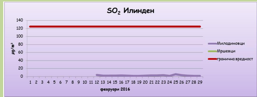
Среднодневни концентрации на сулфур двооксид ( SO_2 )