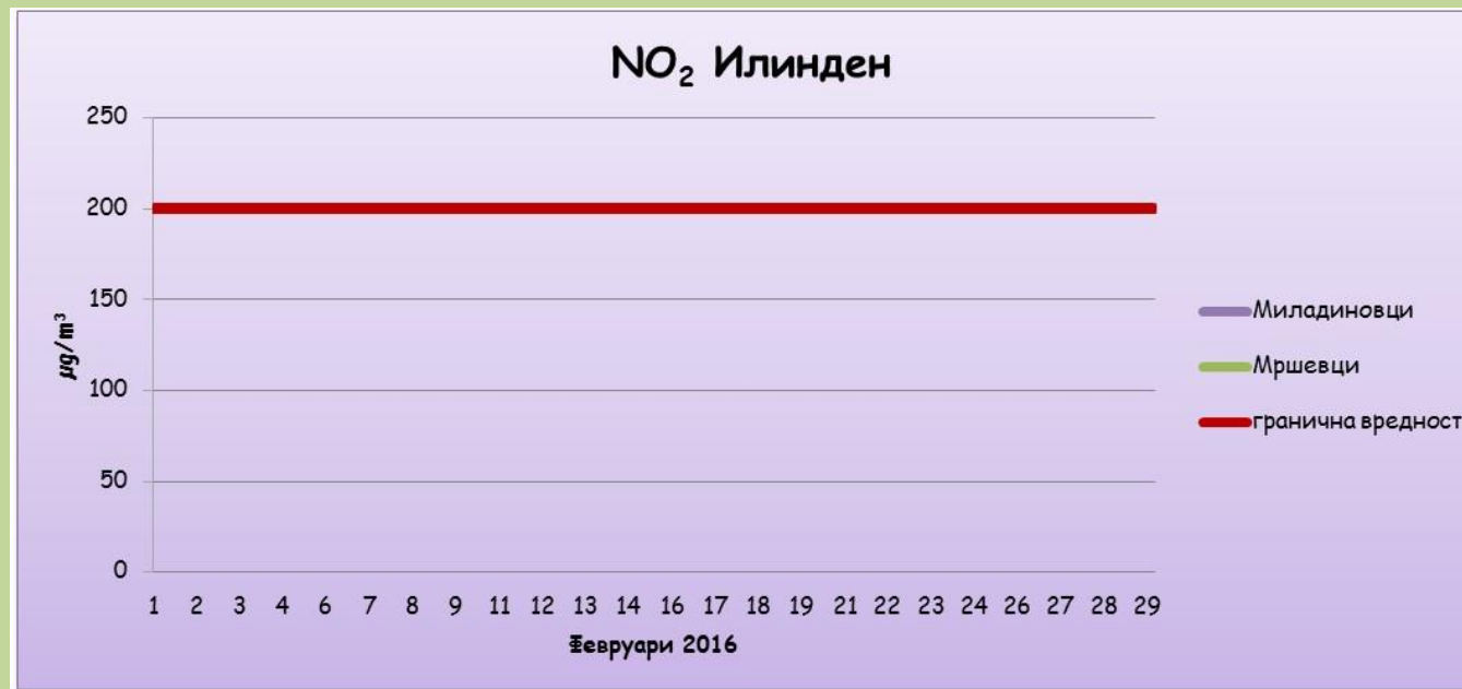
Средночасовни концентрации на азот двооксид ( \text{NO}_2 )