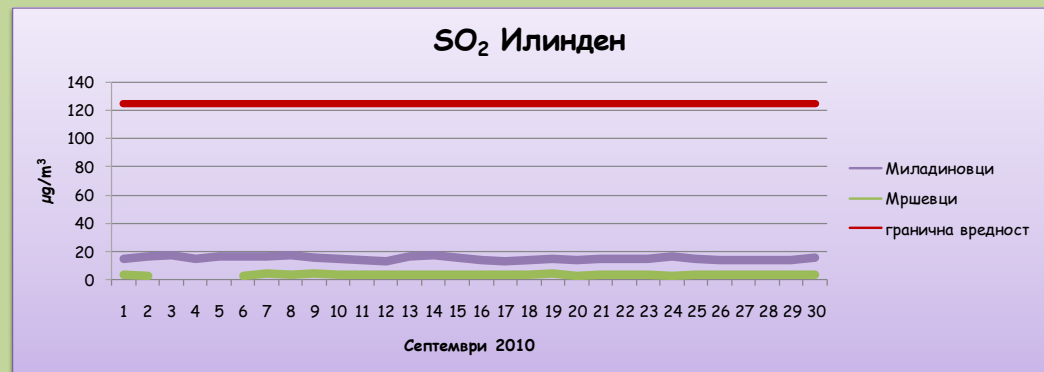
Среднодневни концентрации на сулфур двооксид(SO 2 )