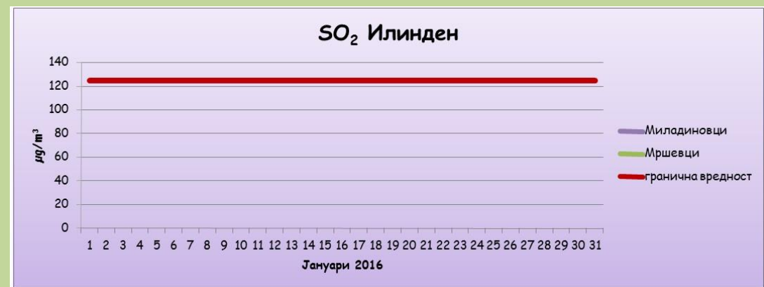
Среднодневни концентрации на сулфур двооксид ( SO_2 )