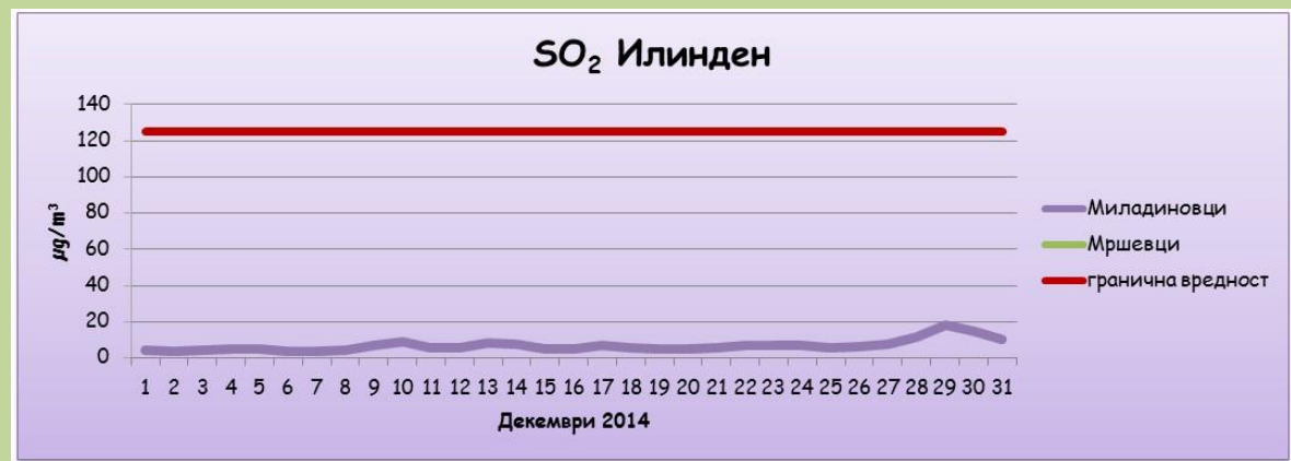
Среднодневни концентрации на сулфур двооксид ( SO_2 )