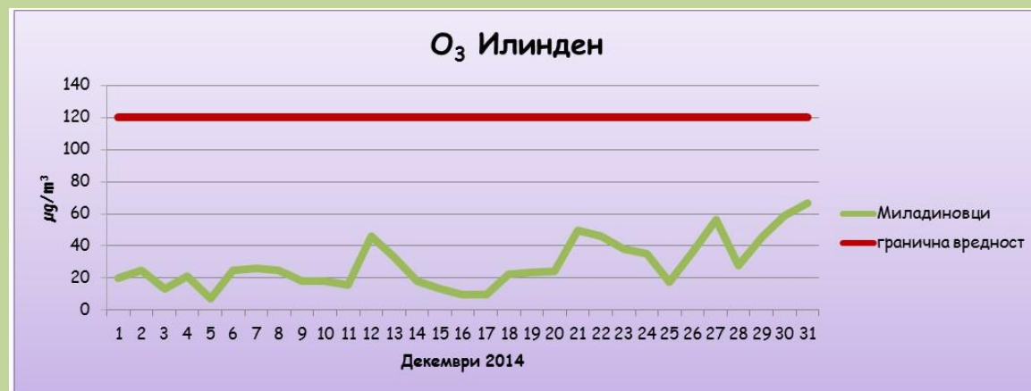
максимални дневни осумчасовни средни вредности на концентрацијата на озон (O 3 )