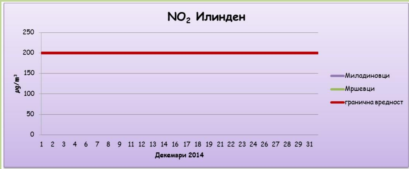
Средночасовни концентрации на азот двооксид (NO 2 )