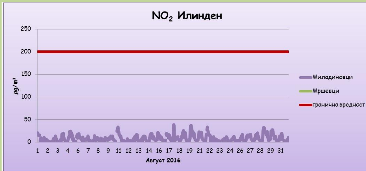
Средночасовни концентрации на азот двооксид ( \text{NO}_2 )