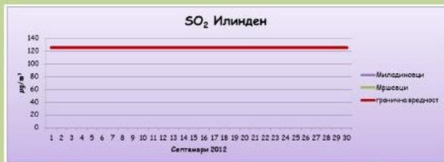
Среднодневни концентрации на сулфур двооксид( SO_2 )