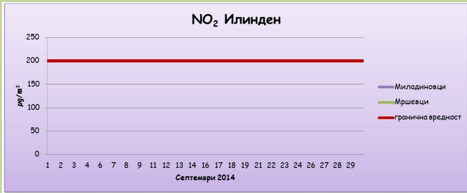
Средночасовни концентрации на азот двооксид (NO 2 )