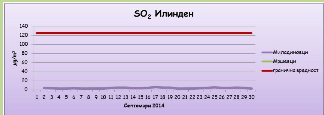
Среднодневни концентрации на сулфур двооксид (SO 2 )