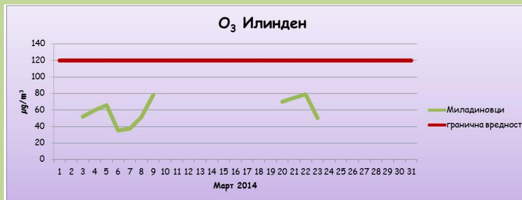
максимални дневни осумчасовни средни вредности на концентрацијата на озон (O 3 )