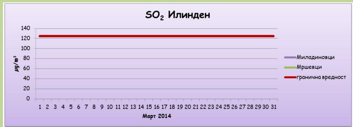
Среднодневни концентрации на сулфур двооксид ( SO_2 )