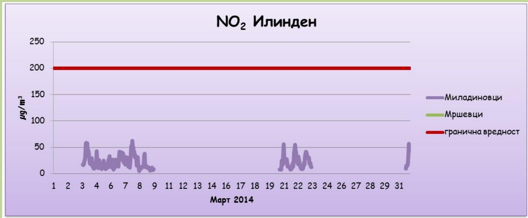
Средночасовни концентрации на азот двооксид (NO 2 )