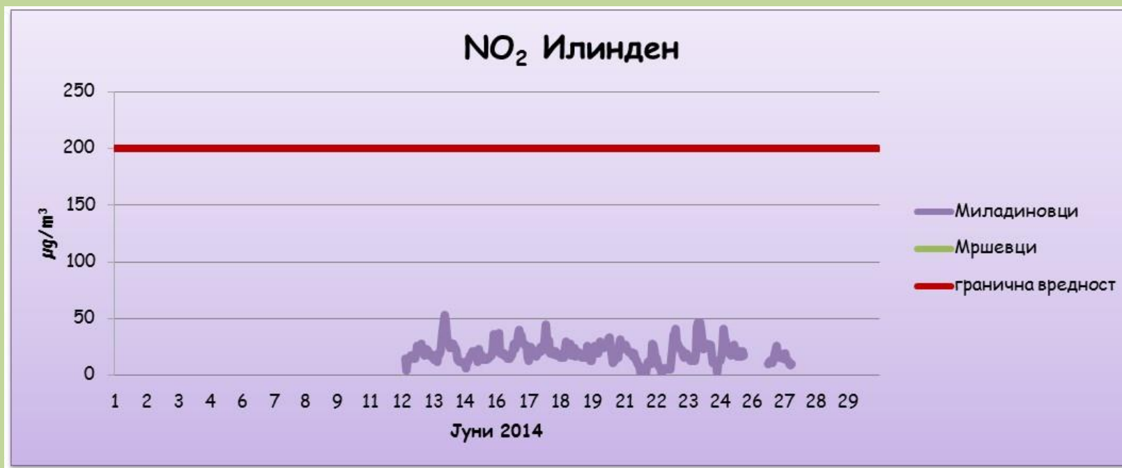
Средночасовни концентрации на азот двооксид (NO 2 )