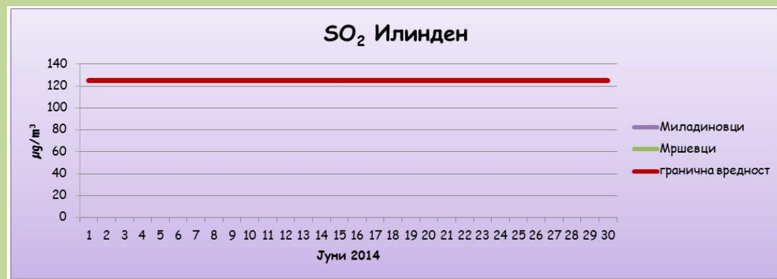
Среднодневни концентрации на сулфур двооксид ( SO_2 )