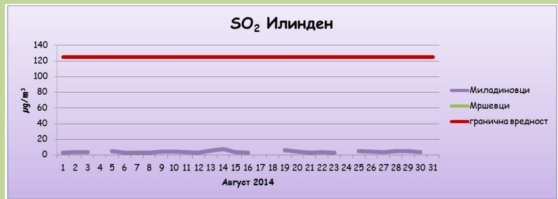
Среднодневни концентрации на сулфур двооксид ( SO_2 )