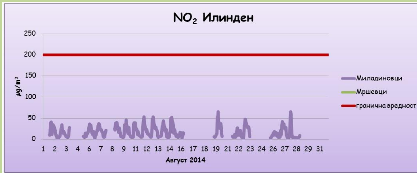
Средночасовни концентрации на азот двооксид (NO 2 )