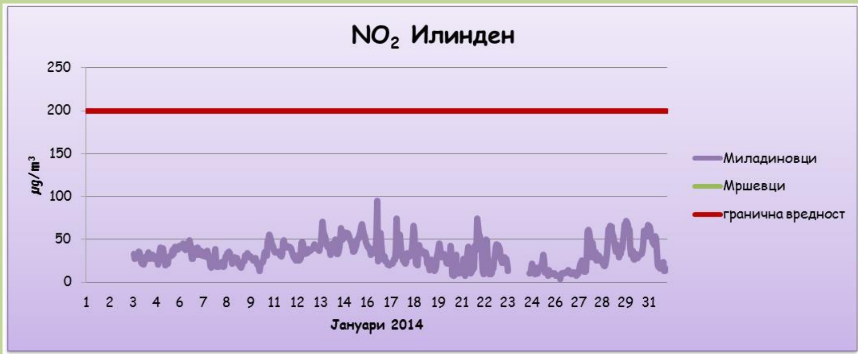
Средночасовни концентрации на азот двооксид (NO 2 )