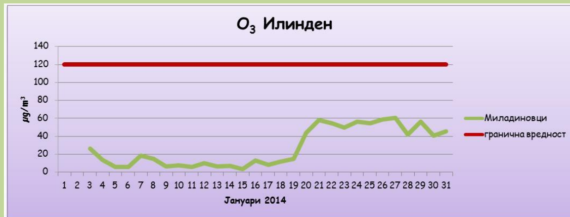
максимални дневни осумчасовни средни вредности на концентрацијата на озон (O 3 )