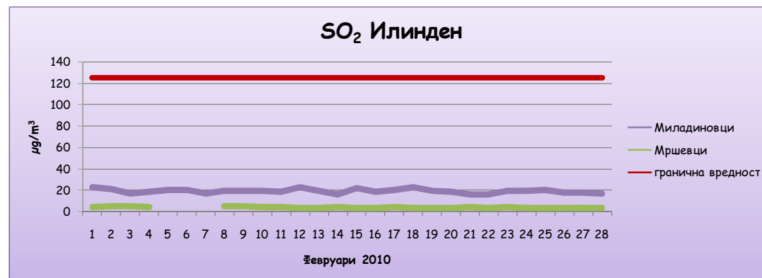
Среднодневни концентрации на сулфур двооксид(SO 2 )