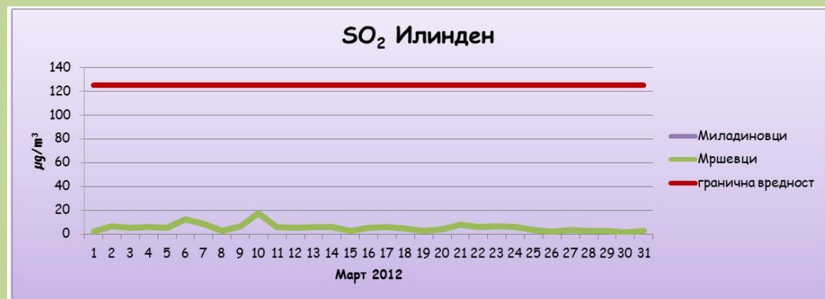
Среднодневни концентрации на сулфур двооксид( SO_2 )