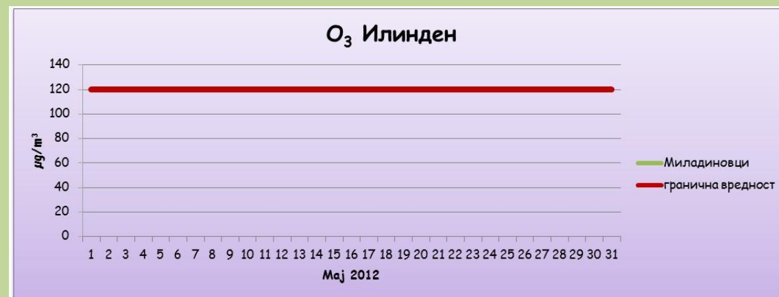
максимални дневни осумчасовни средни вредности на концентрацијатана озон (O 3 )