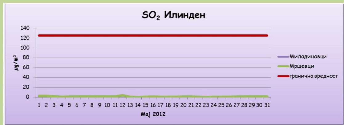
Среднодневни концентрации на сулфур двооксид( SO_2 )